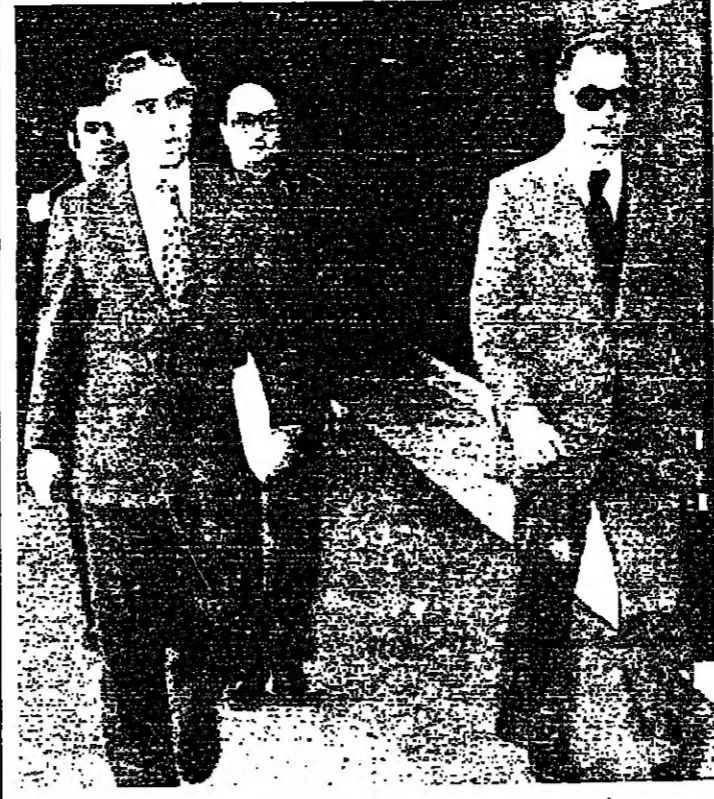
الرئيس سركيس ورئيس الحكومة قبل بدء الجلسة امس .

وكان الرئيس الاسعد قد تداول مع عدد من النواب الوضع العام في البلاد ، واولئك السياسيين الداخلية والخارجية التي تتعلق بقرعة الشرق الاوسط . فقد استقبل الاسعد في مكتبه النواب السادة : محاليل الضاهر ، عبد عويدات ، زكي مزودي ، وبق الخضير ، كما استقبل بعد مراحل بناء المجلس التيمية الجديد . ورضع مع امساحيا الدراسات والعروض التي توصلت اليها وزارة الاشغال العامة و اللجنة البرلمانية .